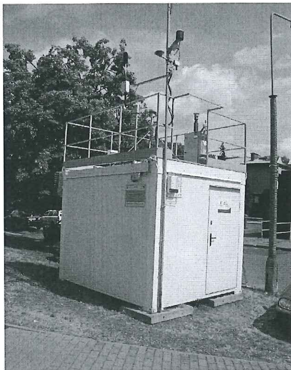
Stacja „OKRZEI” – pomiary emisji zanieczyszczeń powietrza pyłu zawieszonego PM10, metali i benzo(a)pirenu metoda manualną oraz dwutlenku azotu - NO 2 , tlenku azotu – NO, dwutlenku siarki - SO 2 , tlenku węgla – CO, pyłu zawieszonego PM10 oraz parametrów meteorologicznych metodą automatyczną.