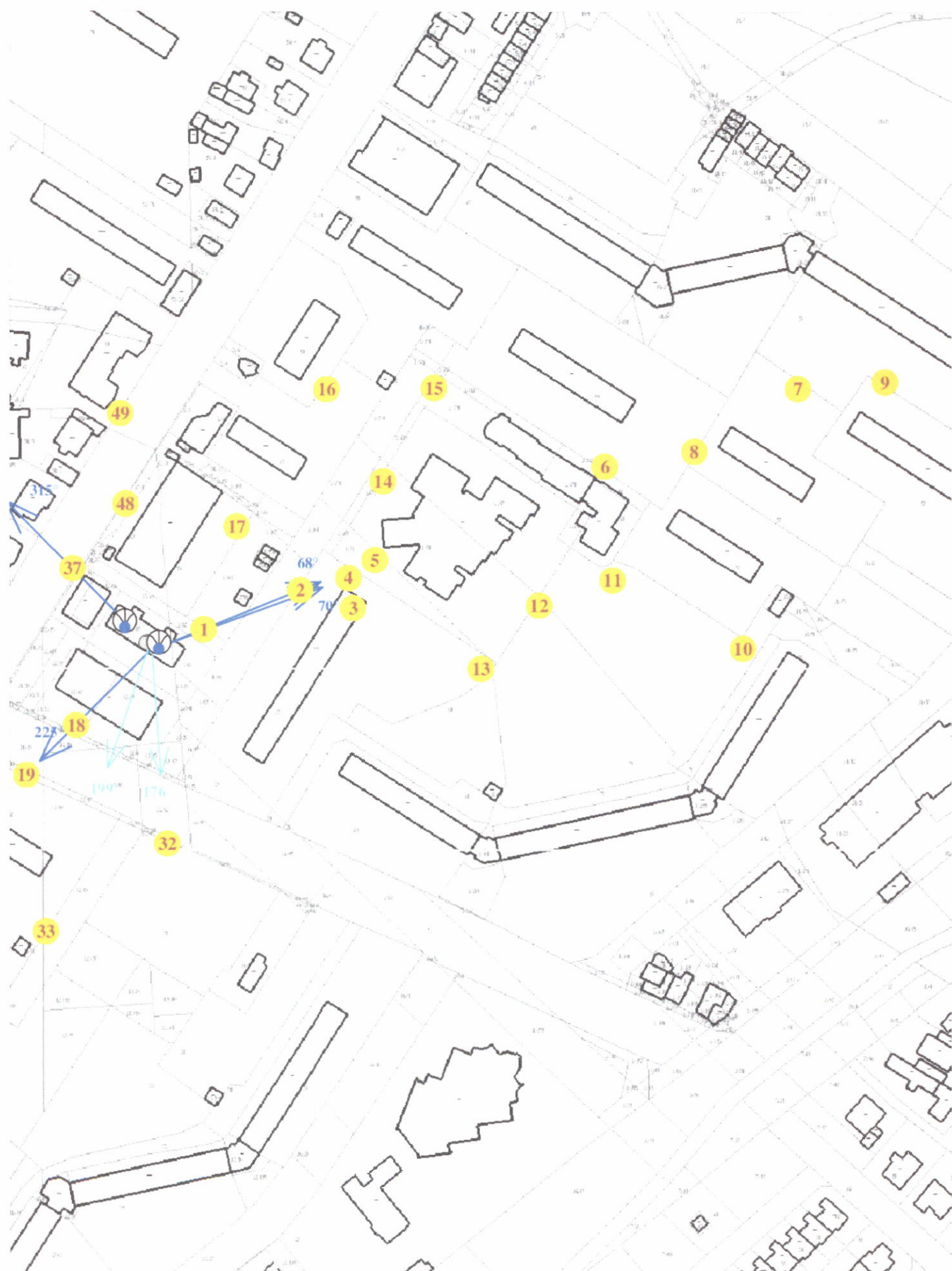
Rys. 2 Lokalizacja pionów pomiarowych

Legenda: brak dostępu antena radiolinowa źródło PEM antena sektorowa pion pomiarowy