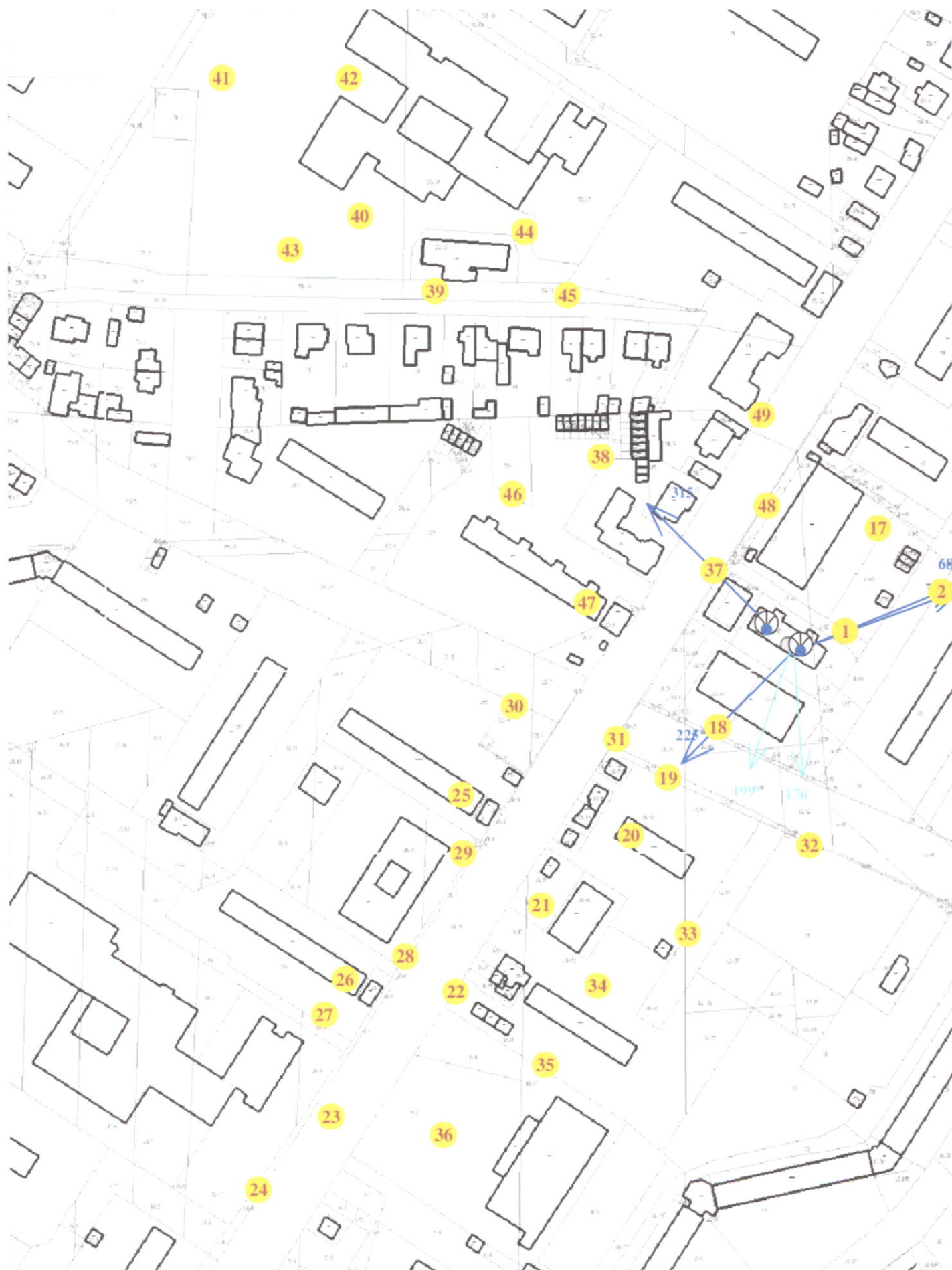
Rys. 3 Lokalizacja pionów pomiarowych