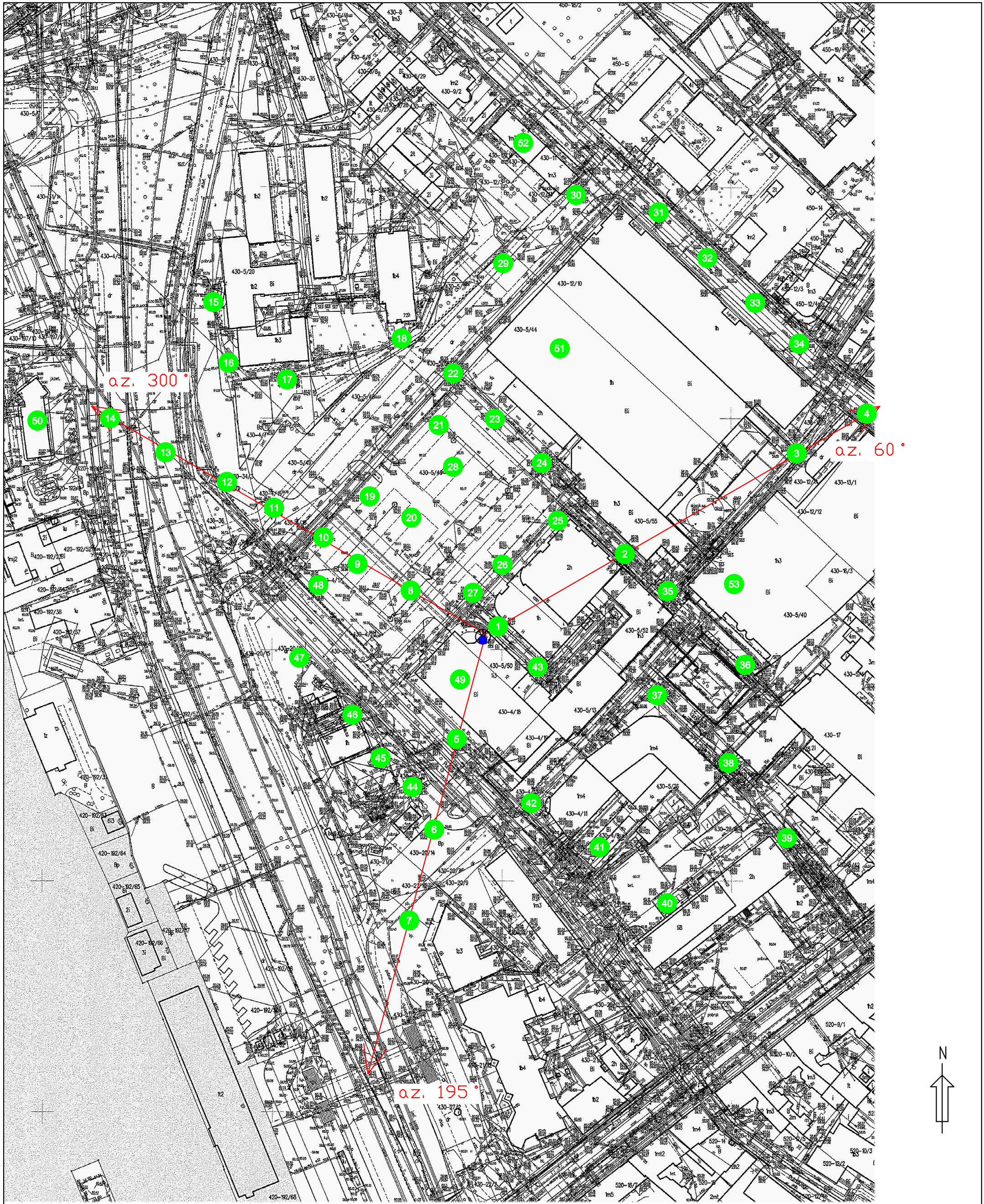
Rys.1 Lokalizacja pionów pomiarowych